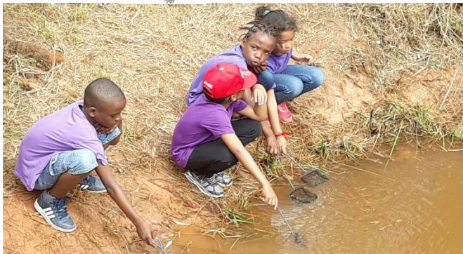
La pêche à l'épuisette

Edelson, Anders, Noha, Sadrack, Mahelys, Théorina