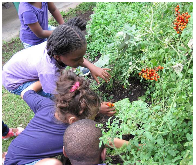
Classe de GS A La cueillette