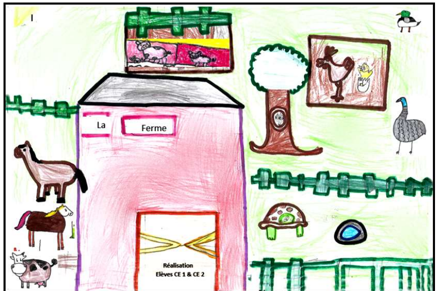
Dessin de la ferme