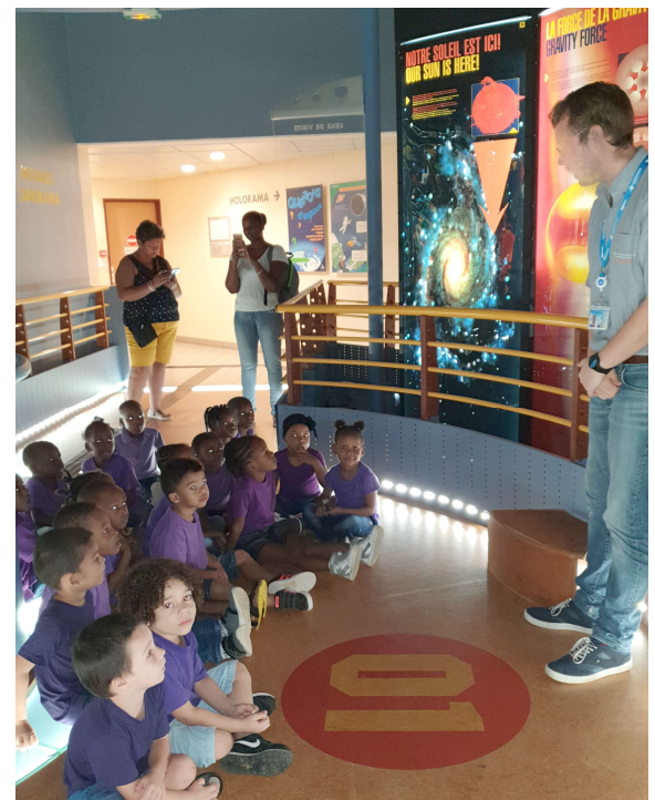
Les petits à l'écoute !