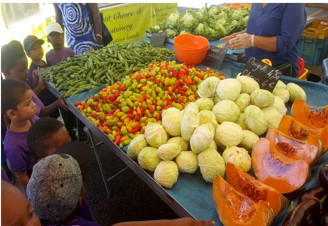
Un étal

Dans le cadre de la semaine du goût, nous avons visité le marché de la commune de Rémire-Montjoly. Nous avons pu voir et découvrir les fruits et légumes de notre pays. Nous avons passé un très bon moment !