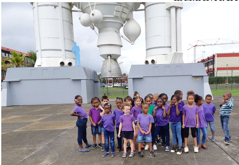
Devant Ariane 5 !