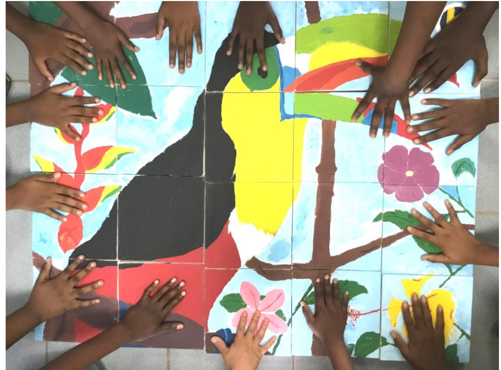
Photo 6 La Guyane entre nos mains