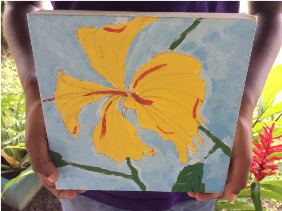
Photo 3 L'Hibiscus jaune

Sur ce cadre il y a une fleur qui s'appelle Hibiscus. On le trouve en Guyane et aussi dans quelques pays et le colibri butine cette fleur avec son long bec. Cette fleur est un arbre tropical à belles fleurs dont une espèce fournit une huile et une autre, un textile.