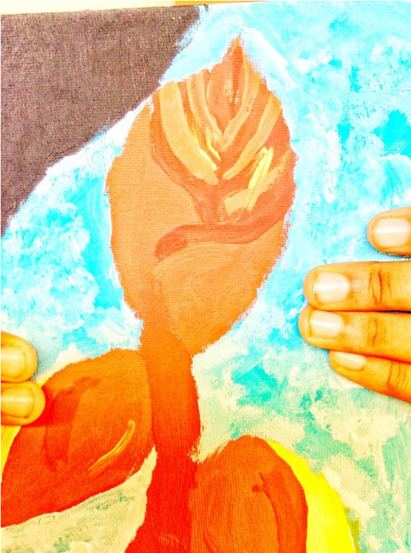
Photo 1 Le Héliconia

Le Héliconia est une plante de Guyane qui représente l'Amazonie et qui peut se régénérer dans l'eau. Il peut servir à certains oiseaux pour faire leurs nids et les oiseaux mouches prennent son nectar.