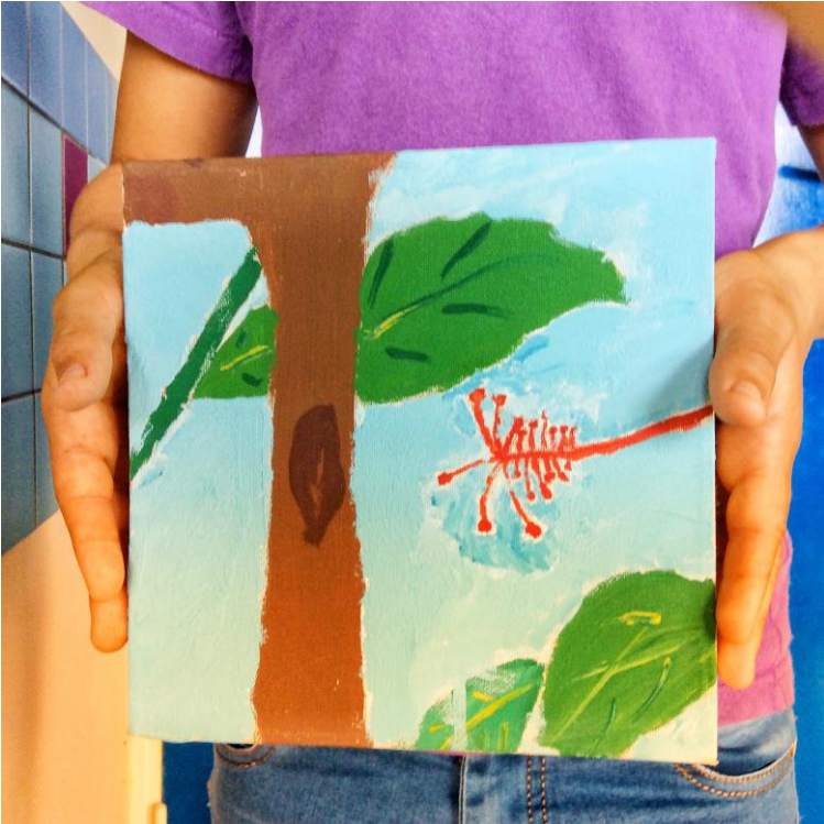
Photo 5 Pistil d'Hibiscus

L'image représente la Guyane parce qu'il y a la fleur et l'arbre dans la forêt de Guyane.