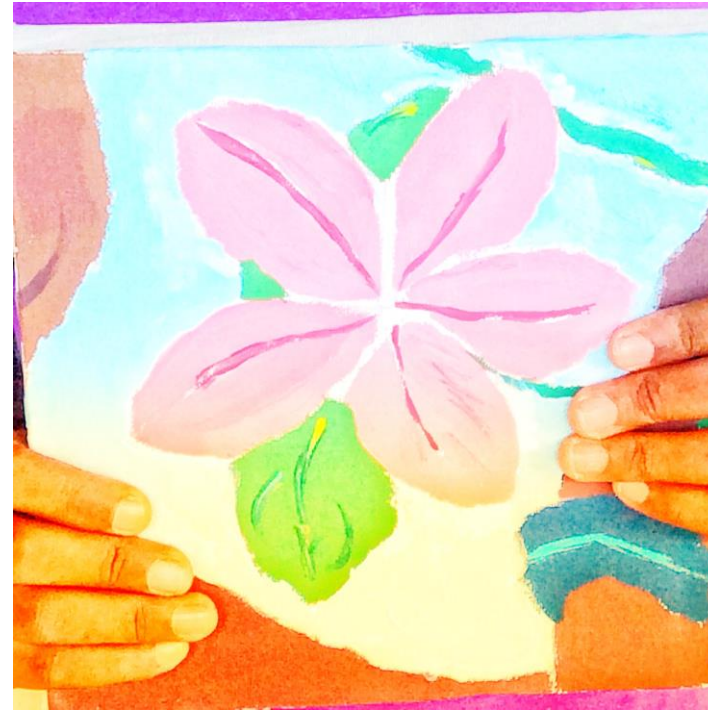
Photo 4 L'Hibiscus rose