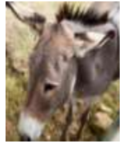
Georlino et Marlone

Nous avons adoré ces films et aller au cinéma avec toute l'école. Certains camarades n'avaient jamais été au cinéma.